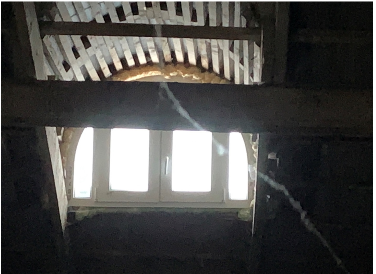
Фото 1,2, 3, 4 смонтированы четыре окна на чердаке киноцентра «Кама», расположенного по адресу: г. Чайковский, ул. Карла Маркса, д. 37 а